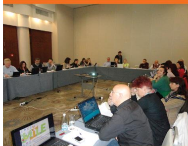
Sofia, 24-25 April 2014