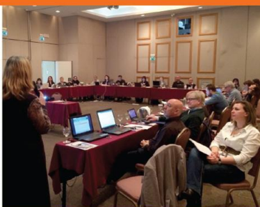
Athens, 26-27 February 2015