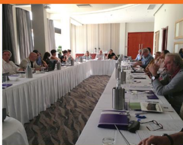
Malta, 23-24 October 2014